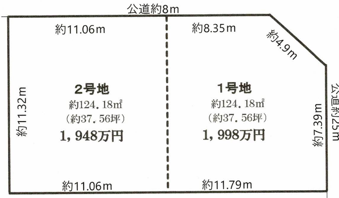
●分筆予定につき面積の増減がする場合があります。 【区画図】確定図ではありません。